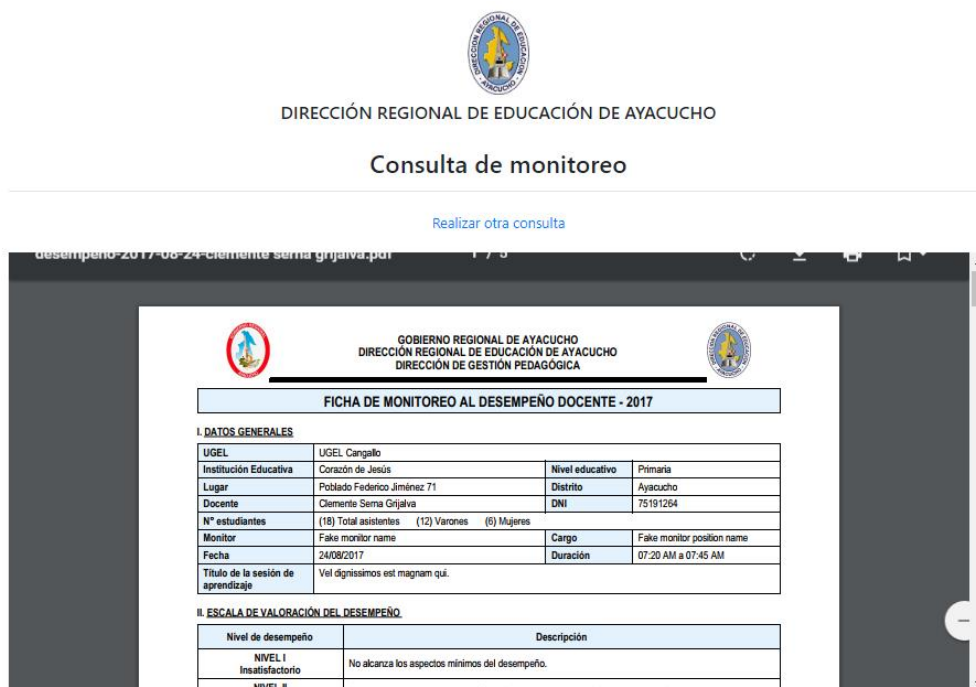
Figura 1.3. Resultado de la búsqueda de monitoreo.

Por el contrario si el monitoreo fue encontrado, la aplicación mostrará el monitoreo en formato PDF como se muestra a continuación.