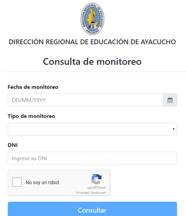
Figura N° 1.1. Interfaz principal. Formulario de búsqueda de monitoreo.

La aplicación mostrará la siguiente interfaz.