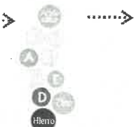
La harina de arroz se mezcla con nutrientes elegidos