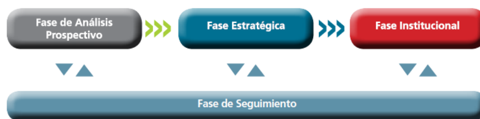
GRAFICO N° 01: FASES DEL PROCESO DE PLANEAMIENTO ESTRATEGICO

Los Gobiernos Regionales se encargan de la redacción del PDRC en la Fase Estratégica, utilizando la información generada en su Fase de Análisis Prospectivo, así como la información provista por los sectores en su proceso de planeamiento estratégico, respecto a sus competencias compartidas.