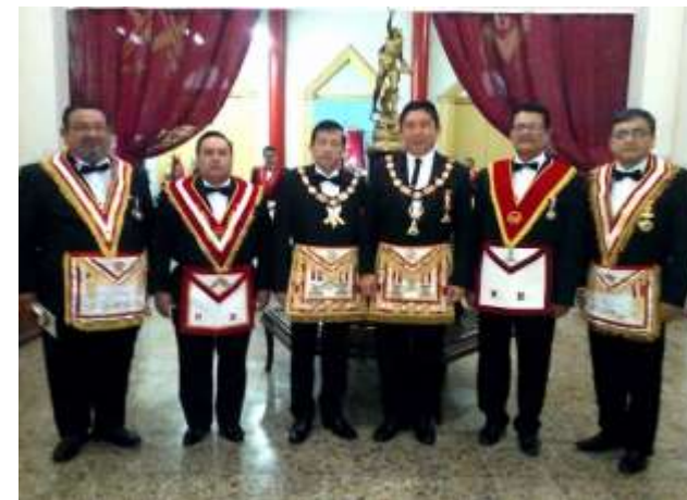
Hermandades o Logias